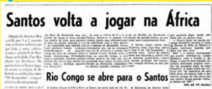
Santos volta a jogar na África Rio Congo se abre para o Santos O Santos parou a guerra, jogando nas duas margens do Rio Congo