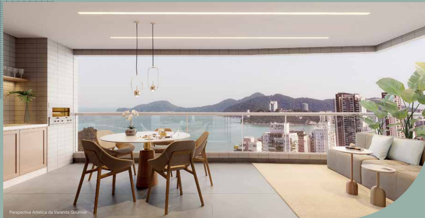
Perspectiva Artística da Varanda Gourmet

Vista panorâmica do exclusivo Mirante a mais de 147 metros de altura