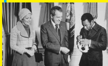
O jogador e sua esposa, assinando uma bola de futebol para o presidente dos EUA, Richard Nixon, na Casa Branca, em 8/5/1973