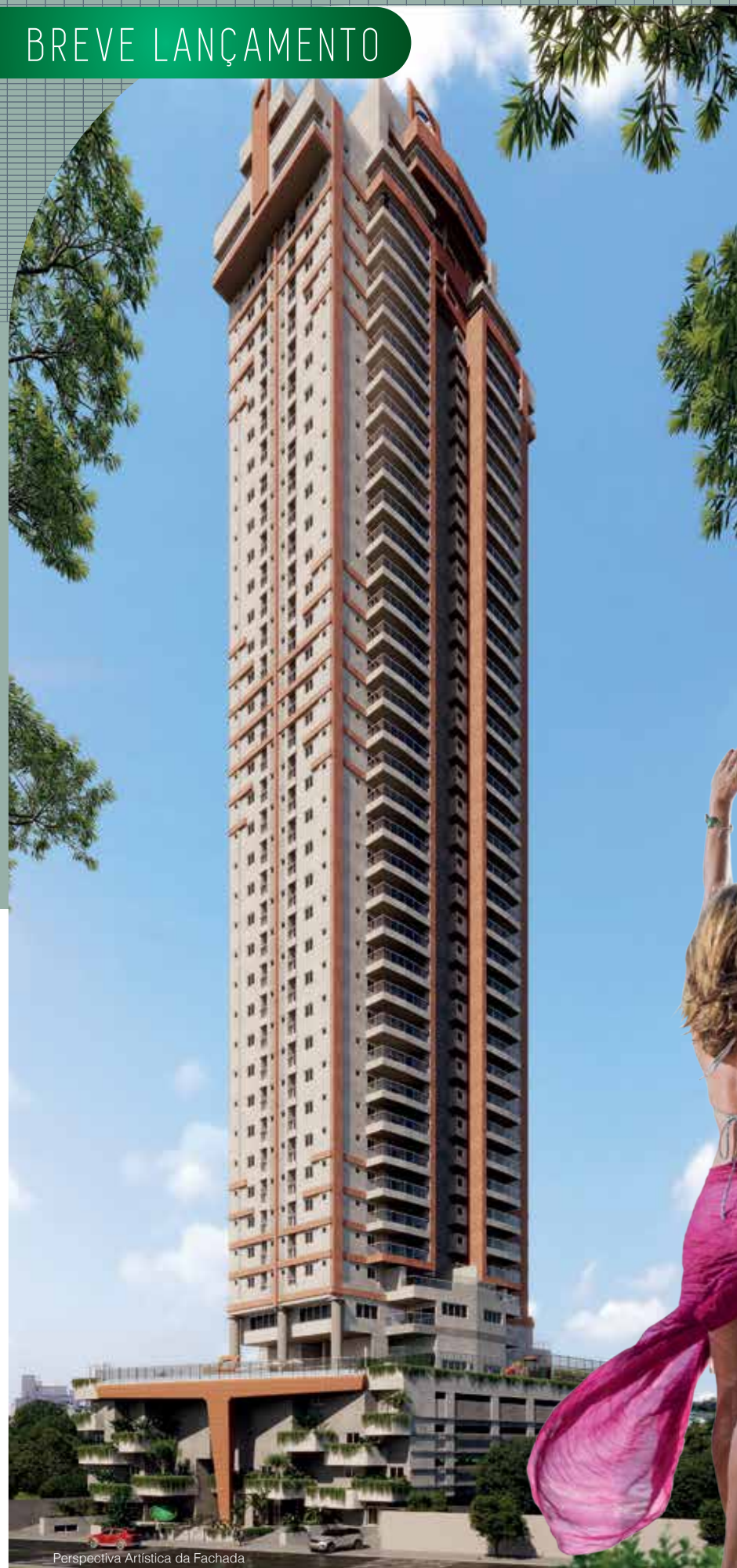
Perspectiva Artística da Fachada