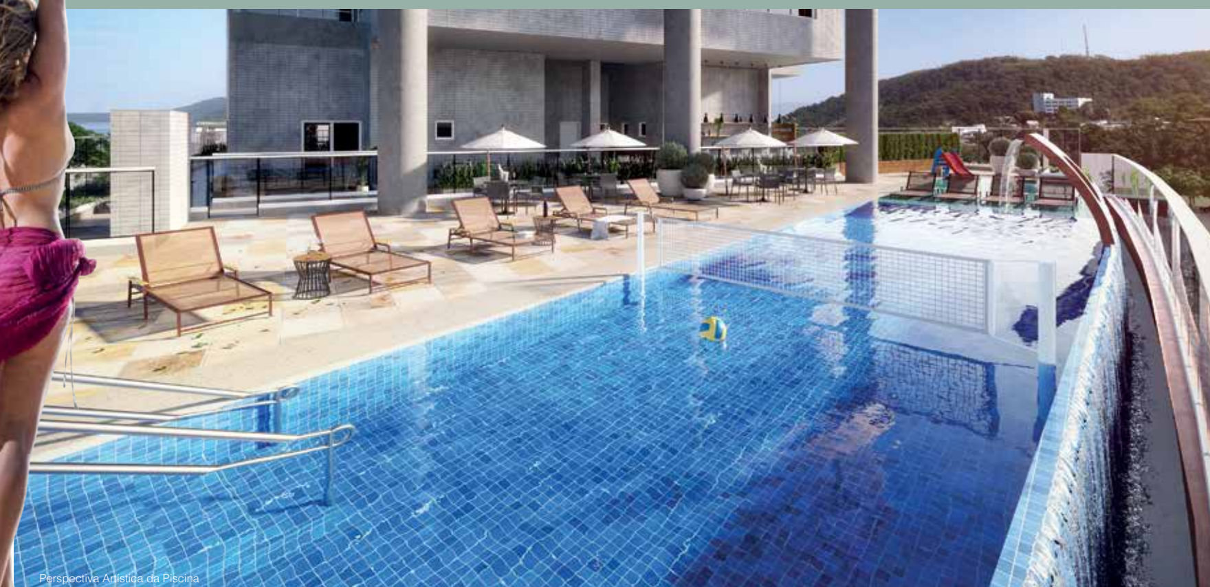
Perspectiva Artística da Piscina

3 suítes | 108 e 112 m 2 2 vagas | lavabo | terraço gourmet