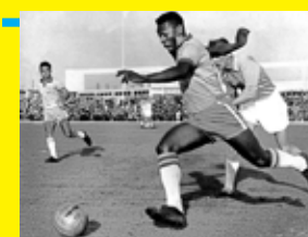
Pelé dribla um zagueiro ao jogar pelo Brasil em maio de 1960

Registra ainda o Guinness que Pelé se envolveu ativamente em campanhas de eliminação da hanseníase no Brasil e num amplo trabalho para causas infantis pelo Unicef: “Pelé se tornou um embaixador internacional do esporte, trabalhando para promover a paz e a compreensão por meio de competições atléticas amistosas”. [CPM]