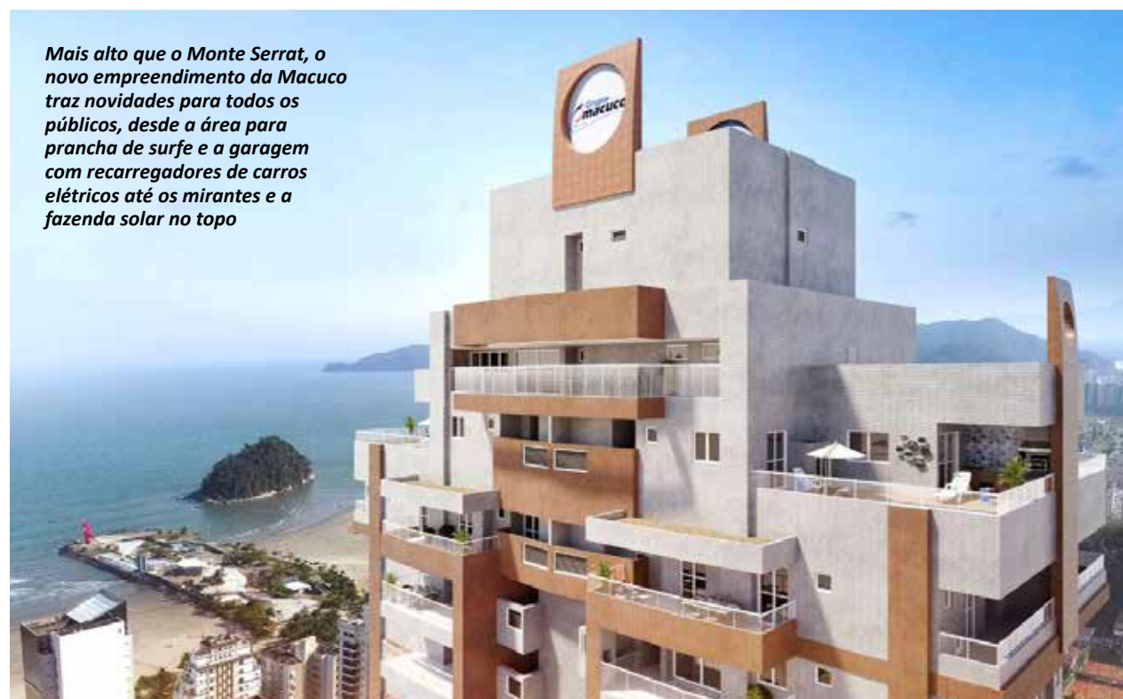
Mais alto que o Monte Serrat, o novo empreendimento da Macuco traz novidades para todos os públicos, desde a área para prancha de surfe e a garagem com recarregadores de carros elétricos até os mirantes e a fazenda solar no topo