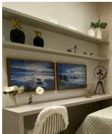
Detalhes fazem a diferença, na decoração com o tema Brasilidade