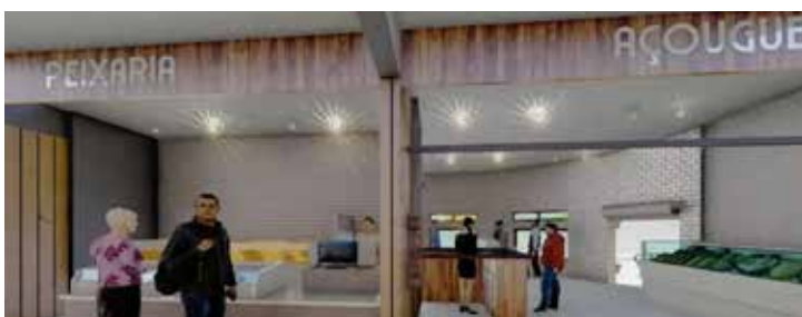
Peixaria e açougue serão repaginados, como as demais dependências do Prédio 1

Neste sentido, Glaucus cita o Bom Prato e outros equipamentos que atendem pessoas em situação de rua: “Seu atendimento será ampliado, integrando-se a Policlínica com o Centro Pop para otimizar as abordagens, com trabalho mais eficiente”. [CPM]