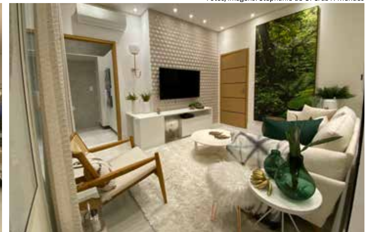
Combinação de cores remete à chamada Arquitetura da Felicidade