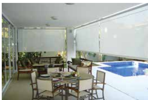
Toldo Vertical Conjugado suaviza os ambientes externos