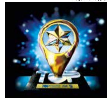
O troféu Top Destinos Turísticos

Em busca de um tricampeonato consecutivo, o município de Santos concorre mais uma vez ao título de Top Destino Turístico. A votação popular prossegue até 31 de outubro de 2021 no site www.votetop.com.br , sendo obrigatória a identificação dos participantes por meio de validação do vínculo social (Facebook).