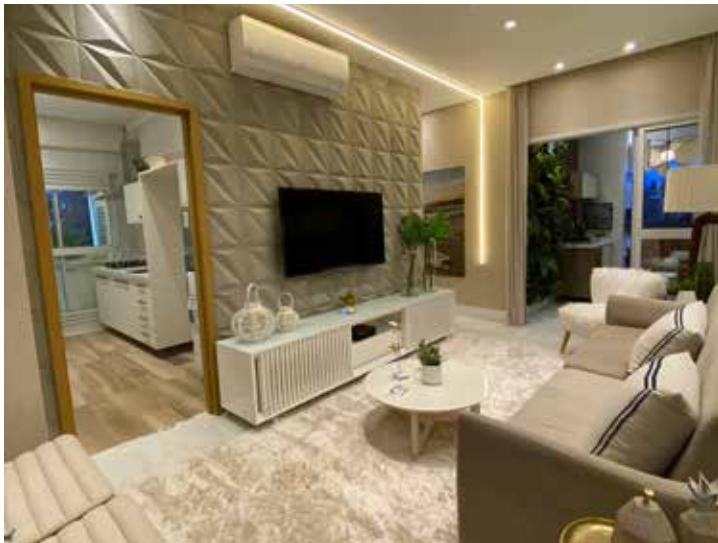
Unidade com três dormitórios harmoniza os espaços pela iluminação