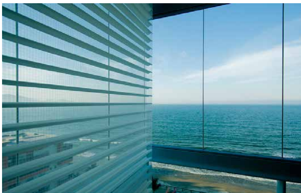
Cortina Diamond Unilux, uma sugestão para as varandas