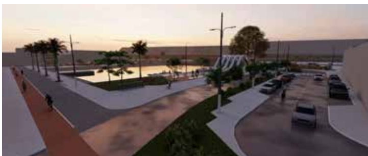
Entorno do Mercado receberá intervenções para integrar modais e valorizar turisticamente a região