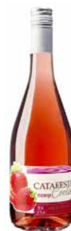
Cooler da vinícola gaúcha Catafesta, que inclui vinho tinto e suco de morango

Aproveitando a oportunidade: grau Lussac ou GL é a quantidade em mililitros de álcool puro contido em 100 mililitros de mistura hidroalcoólica. Por exemplo, o popular “álcool 70%” ou álcool etílico 70 GL é o que