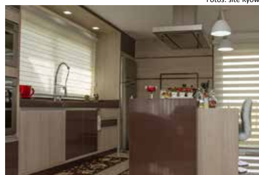
Cortina Shadow Unilux se harmoniza bem com a cozinha