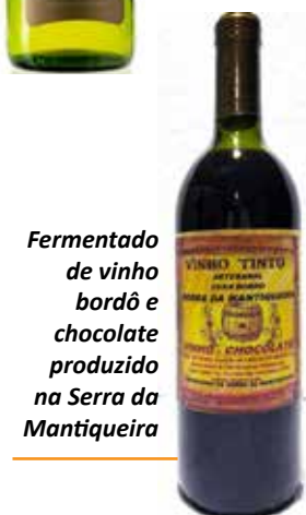
Fermentado de vinho bordô e chocolate produzido na Serra da Mantiqueira

tem densidade igual a 0,700 g/cm³. Lembrando, existe ainda o padrão de graus INPM (criado pelo Instituto Nacional de Pesos e Medidas), relacionado à massa e não à fração de álcool no volume (como o grau GL), o que resulta em valores um pouco diferentes: a massa de álcool presente numa solução 70º INPM é maior do que a de uma solução 70º GL, pois a densidade do álcool etílico é igual a 0,789 g/cm³.