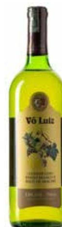
Um cooler com vinho branco e suco de abacaxi, da vinícola catarinense Vó Luiz