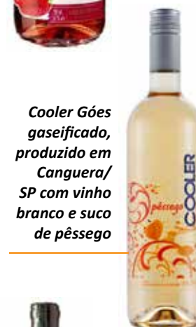
Cooler Góes gaseificado, produzido em Canguera/SP com vinho branco e suco de pêssego