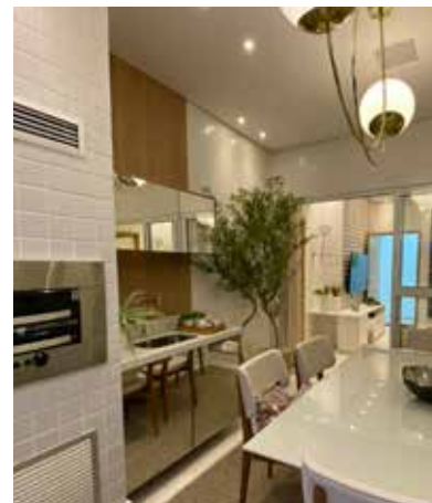
Varanda é valorizada como espaço ‘gourmet’