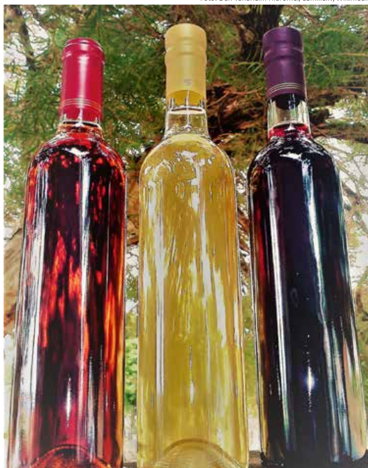
Hidromel é um dos fermentados mais antigos e universais. Três tipos: de cereja, tradicional e Morat

Embora tratados como vinhos, muitos desses produtos estão mais aparentados com a cerveja e o saquê, também produzidos por meio de fermentação, e até com a sidra (com ‘s’), que além de fermentada tem a