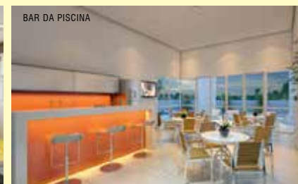
BAR DA PISCINA