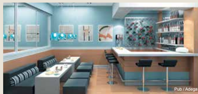
Pub / Adega