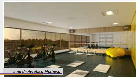
Sala de Aeróbica Multitusa