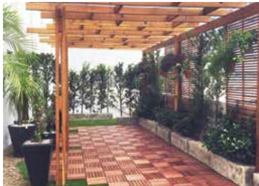
Paisagismo com plantas adequadas melhora o astral de qualquer ambiente

“É tão perfeita que as pessoas tocam para verificar se é natural”