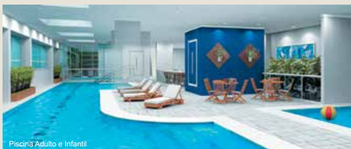
Piscina Adulto e Infantil

entregues totalmente equipados e decorados