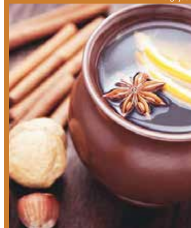
Uma receita para os dias mais frios de junho e julho

Os leitores podem enviar suas receitas de família, com foto da pessoa e autorização para publicação, para anacarolina@construtoramacuco.com.br