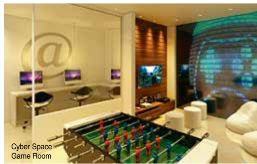
Cyber Space Game Room