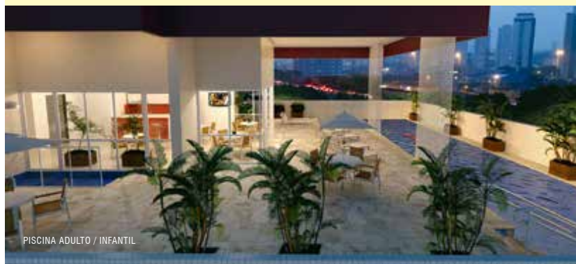
PISCINA ADULTO / INFANTIL