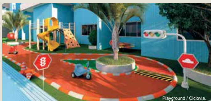
Playground / Ciclovia.