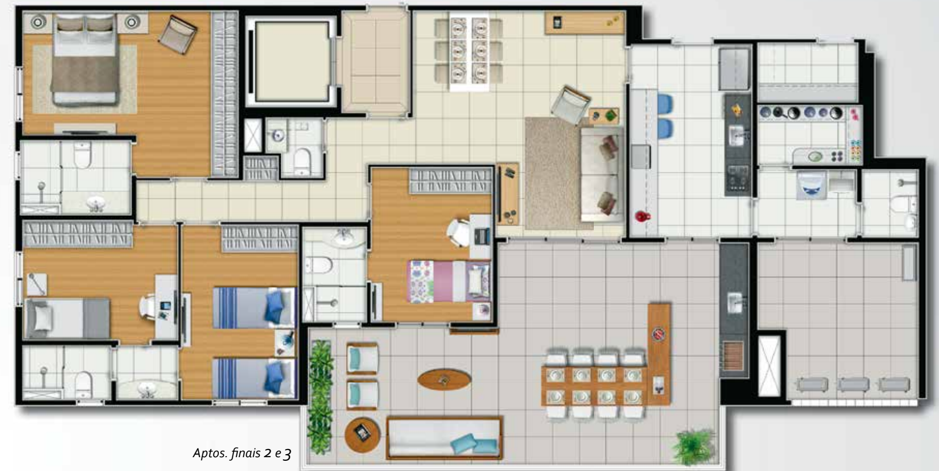
Aptos. finais 2 e 3