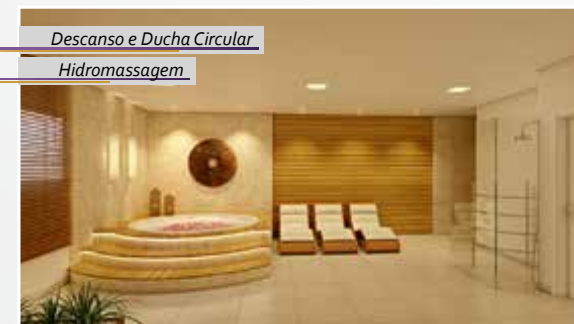
Descanso e Ducha Circular Hidromassagem