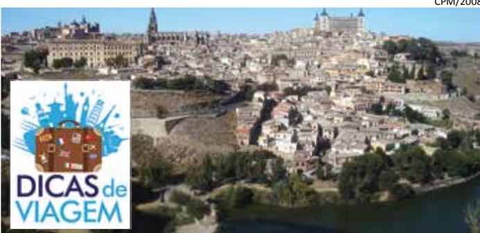
Com o rio Tajo em primeiro plano, vê-se do mirante o Alcázar à direita e a Catedral à esquerda