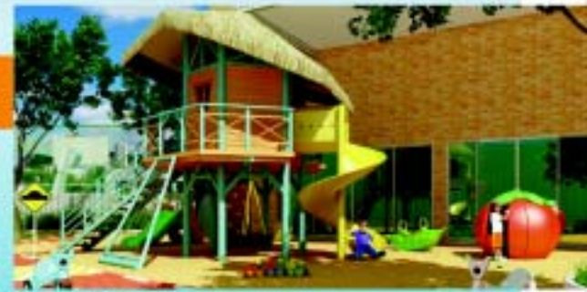
Playground - Ciclovia