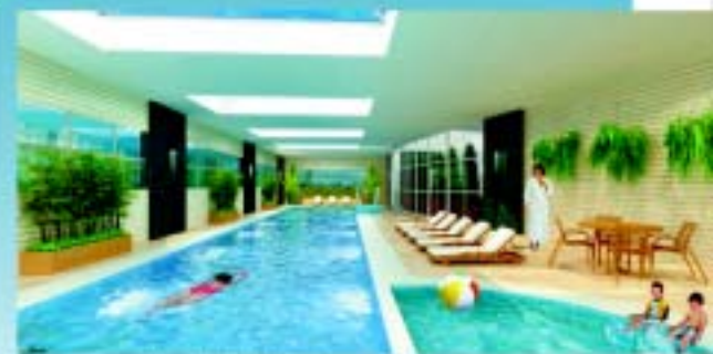
Piscina aquecida adulto e infantil