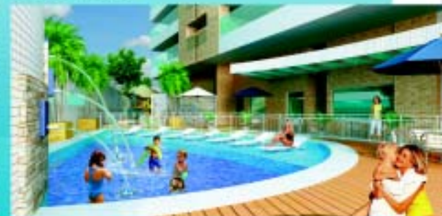
Piscina Infantil - Deck molhado

Preço Inacreditável. Você não pode perder. A partir de R$ 727.000,00*