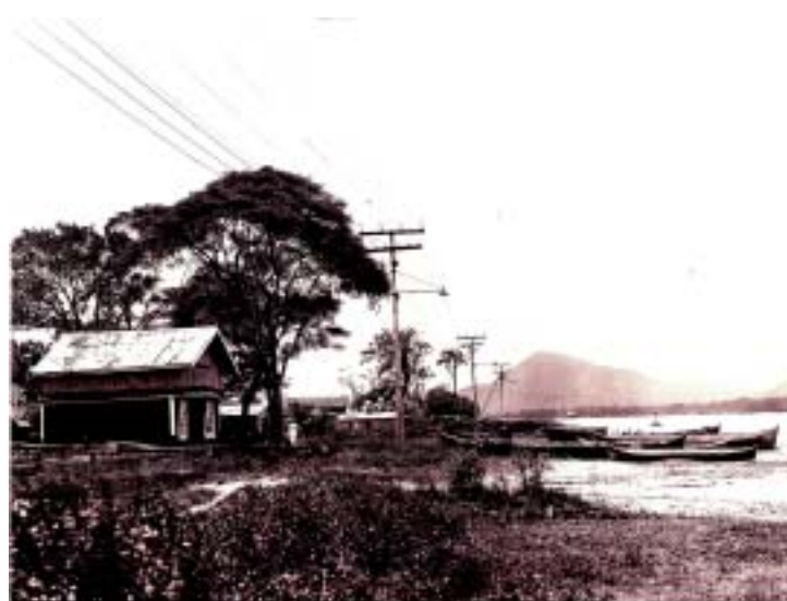
Raros chalés, na foto de José Marques Pereira, cerca de 1920

A quietude do local escondia muitos episódios curiosos, como o sequestro de um bonde, o encalhe do navio ‘Recreio’, a