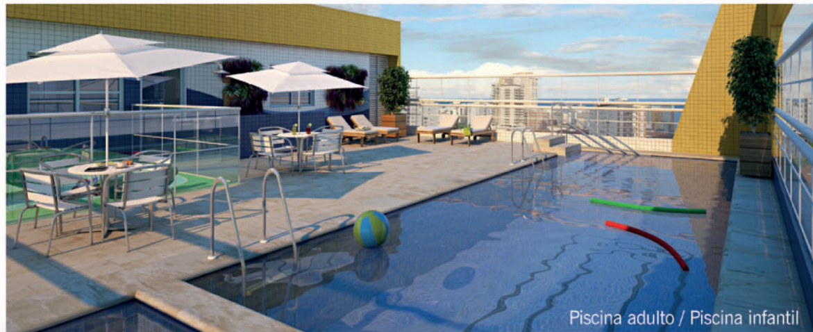
Piscina adulto / Piscina infantil