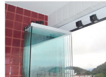
Versátil, o sistema se adapta a qualquer ambiente e necessidade,

vo, os custos devem variar. O engenheiro informa que, nem sempre o vidro não é vendido por metro quadrado ao consumidor final. "O valor depende da sacada e do modelo. Alguns ambientes podem requerer o uso do material do teto ao chão, caindo, assim, o preço do metro quadrado para o lojista, refletindo no custo do projeto ao cliente", explica.