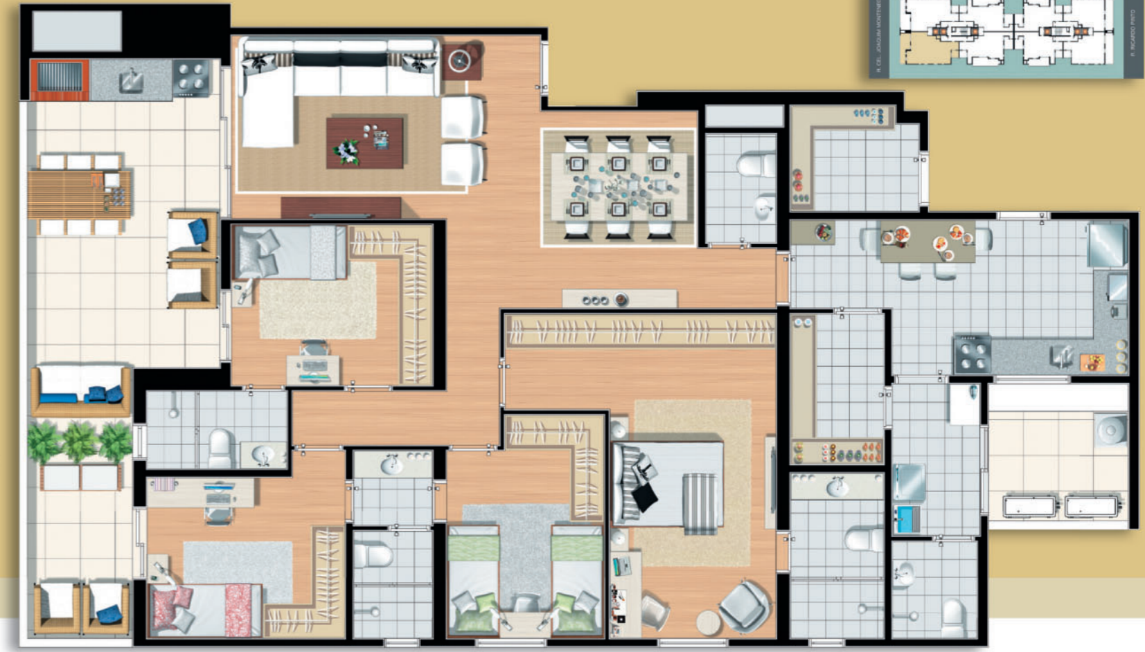
Final 1 • Torre Monti Nero