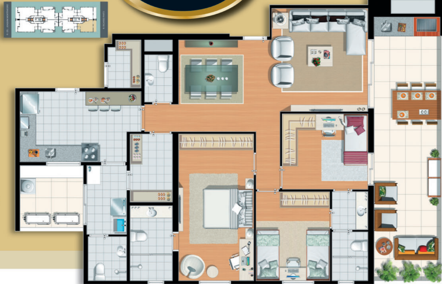
Final 2 • Torre Monti Bianco