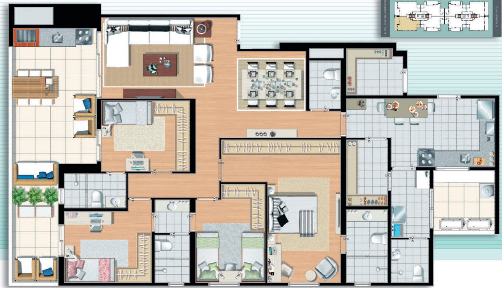
Final 1 • Torre Monti Nero