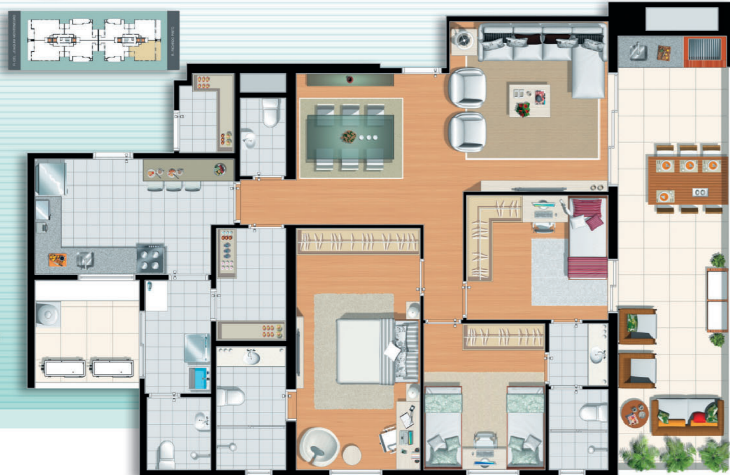
Final 2 • Torre Monti Bianco