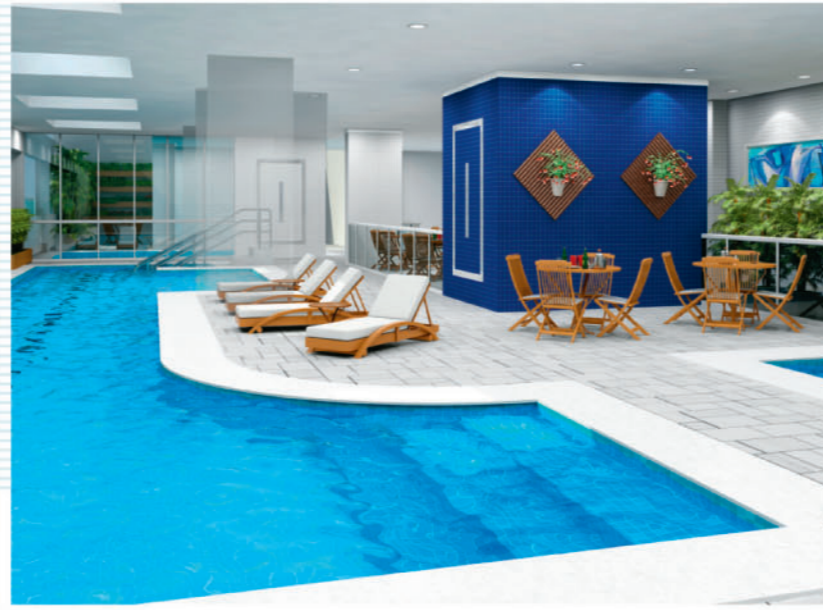
PISCINA ADULTO E INFANTIL